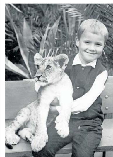
Sexpfer: Jens B. sperrten sie wochenlang ein.

Die Selbstmordversuche in Torgau scheitern fast immer, manche